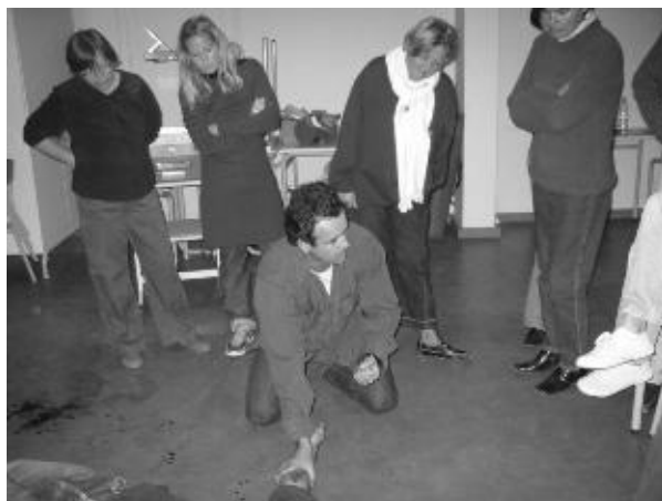
Des « élèves » attentives