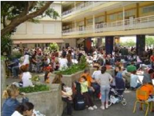
Rassemblement au lycée français pour l'évacuation