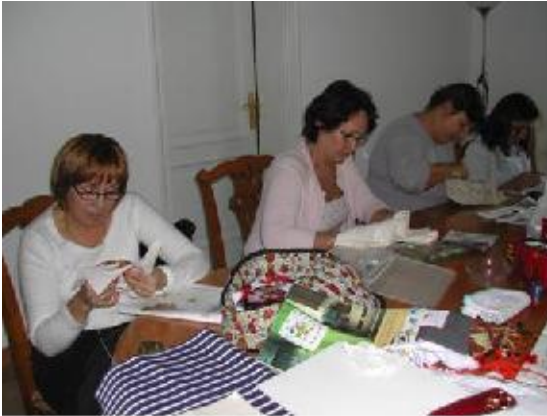
Un point à l'endroit...