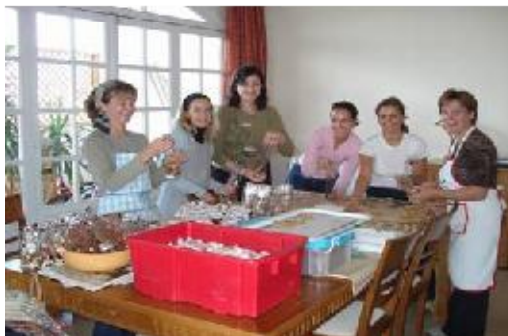
Bonne humeur assurée lors de l'atelier confiserie.

Le bazar de Noël, étant un des événements caritatifs de notre communauté nous remercions toutes les clientes qui sont venues en grand nombre faire généreusement leurs achats. Leur contribution a permis de dégager 4588 Livres de bénéfices qui seront intégralement reversés aux associations que nous soutenons.