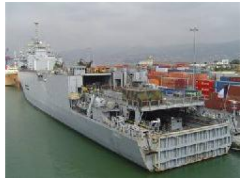
Le Sirocco, navire militaire français faisant des rotations

Les jours passent, se suivent et se ressemblent. Nous entendions les avions passer en repérage au-dessus de nos têtes. A leur retour ils bombardaient. Le blocus maritime a très vite été mis en place. Les navires et leurs canons se sont installés face à notre terrasse. Nous étions devenus otages, enfermés dans le pays. Impossible de savoir comment partir. Le seul mot d'ordre de l'ambassade était de rester chez nous et d'éviter d'essayer de quitter le pays.