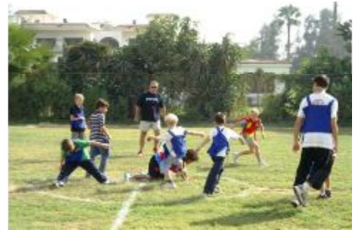
Nos têtes blondes dans le feu de l'action.