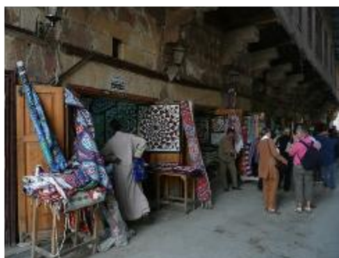
Découverte du Caire islamique et séance shopping dans le souk des tentes.