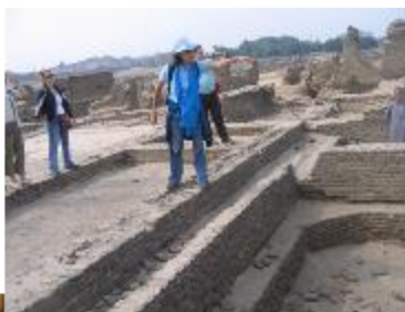
Le cycle islamique avec Maha débute sur les ruines de Fostat.