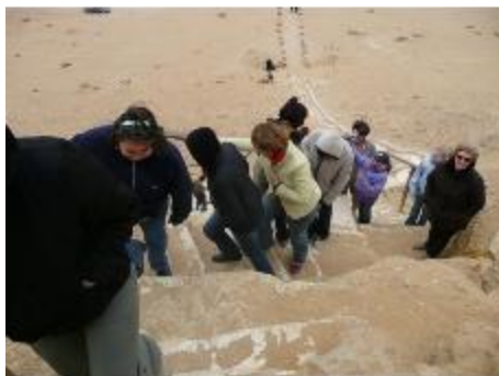
Ascension de Dahchour...non ce n'est pas le Mont Saint-Michel sous un crachin breton.