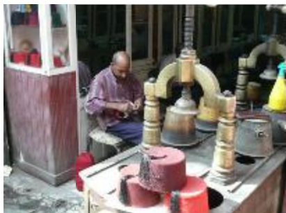
Le tarbouche n'a plus de secret pour nous !