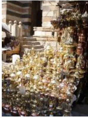
L'Egypte précurseur de la tendance "bling-bling"?