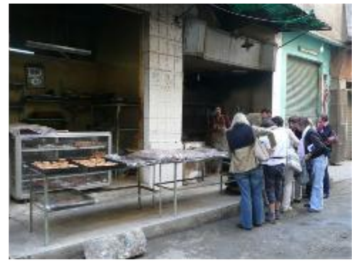
Pause gourmande chez le boulanger.