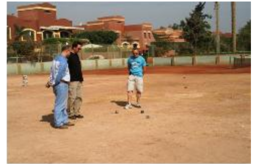
Journée familiale au Sakkara Country Club. Tu tires ou tu pointes ?