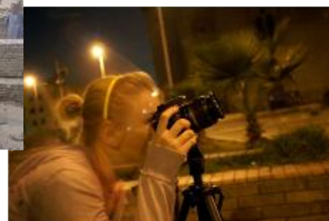
Cours de photo de nuit pour les jeunes...futurs artistes !