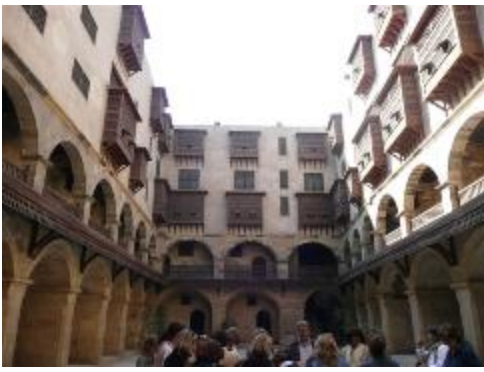
Caravensérail, symbole réhabilité du commerce passé.