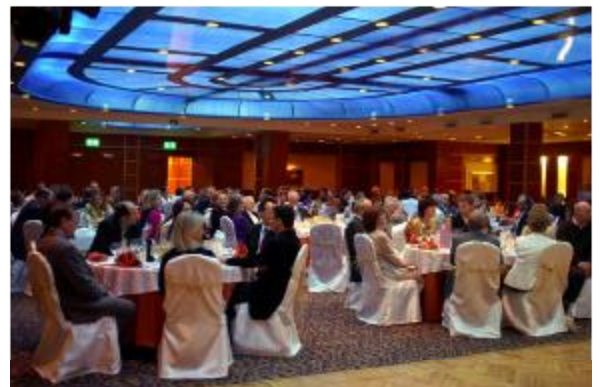
Soirée de gala au Sofitel Maadi. Les saveurs du monde dégustées dans un aquarium.