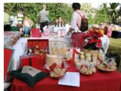
Nos petites mains ont oeuvré pour le bazar de Noël... l'ambiance est digne des soldes en France pour acheter l'objet ou le mets convoité !