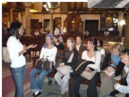
Visite du quartier copte.