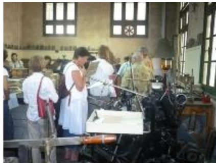
Portes ouvertes à l'IFAO qui nous dévoile son ancienne imprimerie.