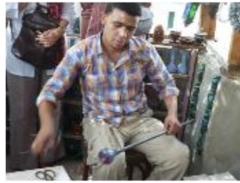
Souffleur de verre.