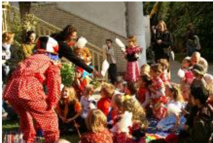
Le carnaval des enfants haut en couleurs.