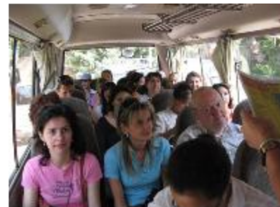
En route pour découvrir les bonnes adresses de Maadi.