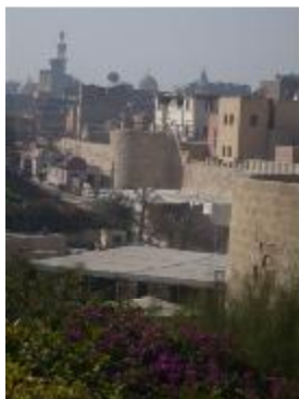
Fouilles archéologiques du parc Al-Azhar