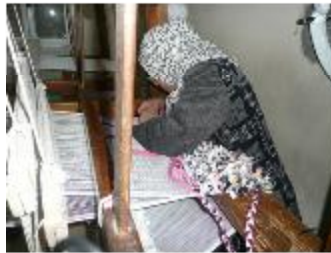
Les petites mains de l'APE nous font partager leur savoir-faire.