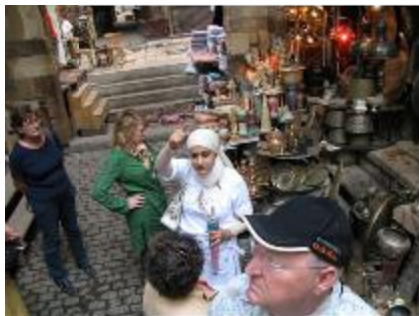
Khan El Khalili, son architecture, son histoire (sa quiétude!) se livrent à nous avant l'arrivée des touristes.