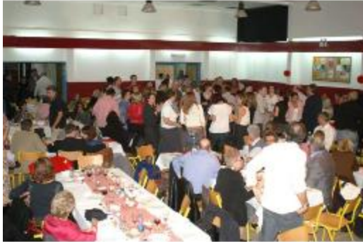
Soirée inter-associations. Ambiance terroir au LFC avec charcuterie, fromage et beaujolais nouveau...ne manquait que la musette !